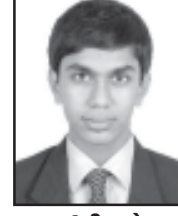
પુશા ઉતીન લોડાયા નવી મુંબઇ CBSE (12 th ) 90%