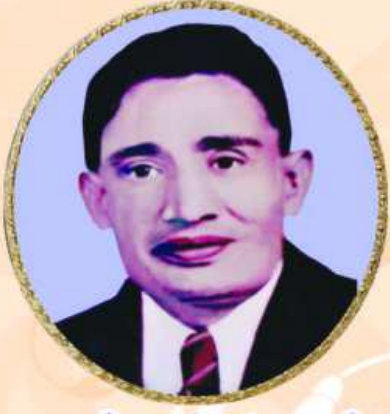
સ્વ. મણીલાલ પદમશી દંડ